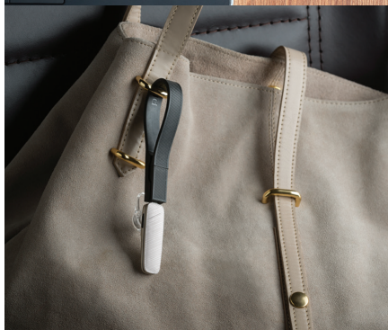
Многофункциональный кабель USB