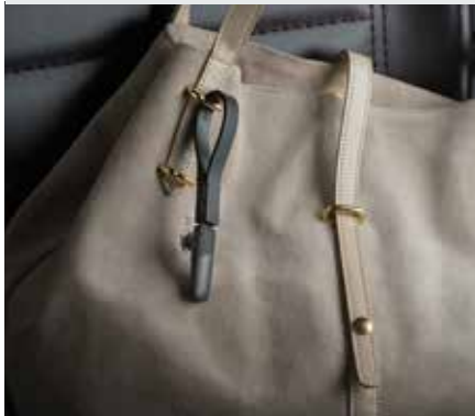
兩用 USB 掛帶